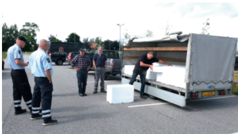
Åleyngel skifter ejer, medens fiskerikontrollen ser på om alt er korrekt