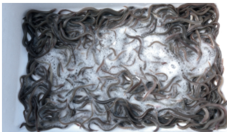
Kasse med åleyngel

De glasål, vi fik med, er fisket op i Frankrig og kørt herop og er en del af en EUs genopretningsplan for ål.