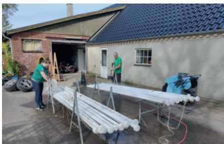
Der rengøres og prøveopstilles

Det bliver en arbejdsgruppe under borgerforeningen, som så mange andre, men dette flaglaug får nogle skrevne retningslinier og en nedskrevet målsætning for laug'ets virke. Så vi behøver ikke lave en stiftende generalforsamling. Vi kan bare gå i gang og ja, "vi" betyder, at jeg er med, indtil videre.