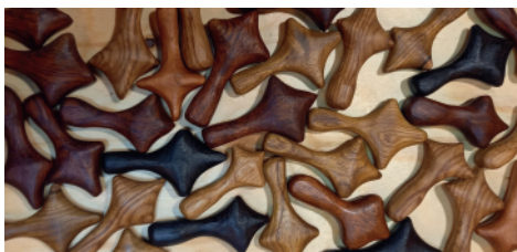
Lån et trækors ved indgangen og hold om under meditationen

Så sæt dig godt til rette og nyd en halv times wellness for sjælen.