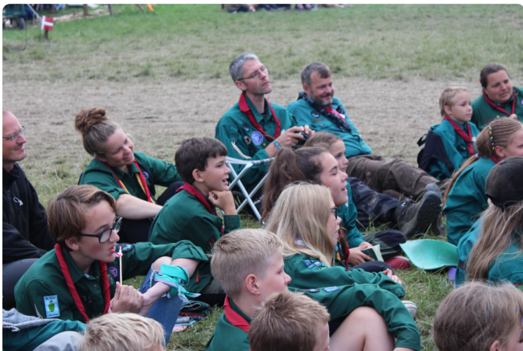
Forventning ved lejrballen i Sønderborg

Oplevelserne stod i kø, og stemningen er svær at beskrive - men vi var der. Kæmpe tak til alle børn og voksne. Specielt er jeg imponeret over de voksne, der deltager, uden at deres børn er med. Det kræver passion, og det nyder vi andre godt af. Næste store lejr er i 2022.