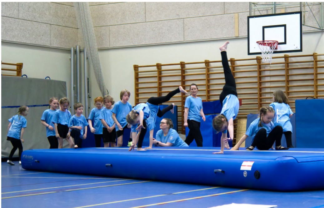
Øvelser på airtrack