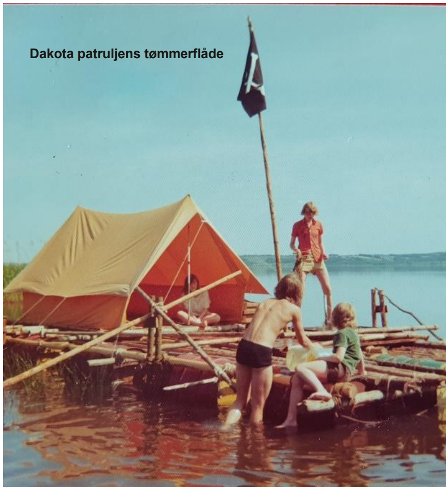
Dakota patruljens tømmerflåde

Måske vi ses til 60-års jubilæet 9. september?