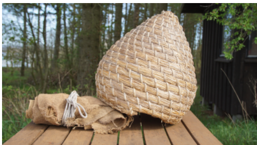
100 gammel halmkube

Min halmkube er ikke et bistade, men en sværnkube, som jeg bruger, når jeg er ude at hente en sværm, som har placeret sig et uhensigtsmæssigt sted i folks haver og udhuse. Som jeg f.eks. gjorde på Gantrupvej sidste år.