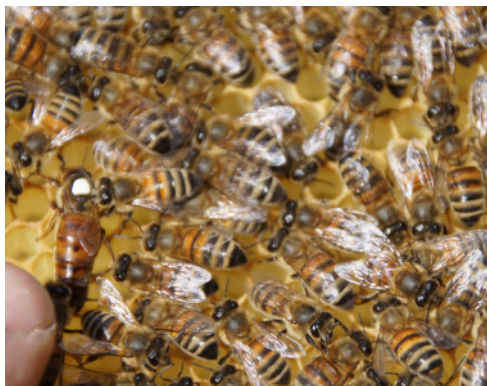
Dronningen (hvid malingsplet på nakken) omgivet af alle sine hunbier

stadig kun 35 grader inde i stadet. Bierne henter vand, så deres "aircondition anlæg" kan fungere. Man fodrer ikke med sukker i Australien, det er ikke nødvendigt, derimod skal man "fodre" med vand om sommeren, hvis der ikke er et vandhul i nærheden.